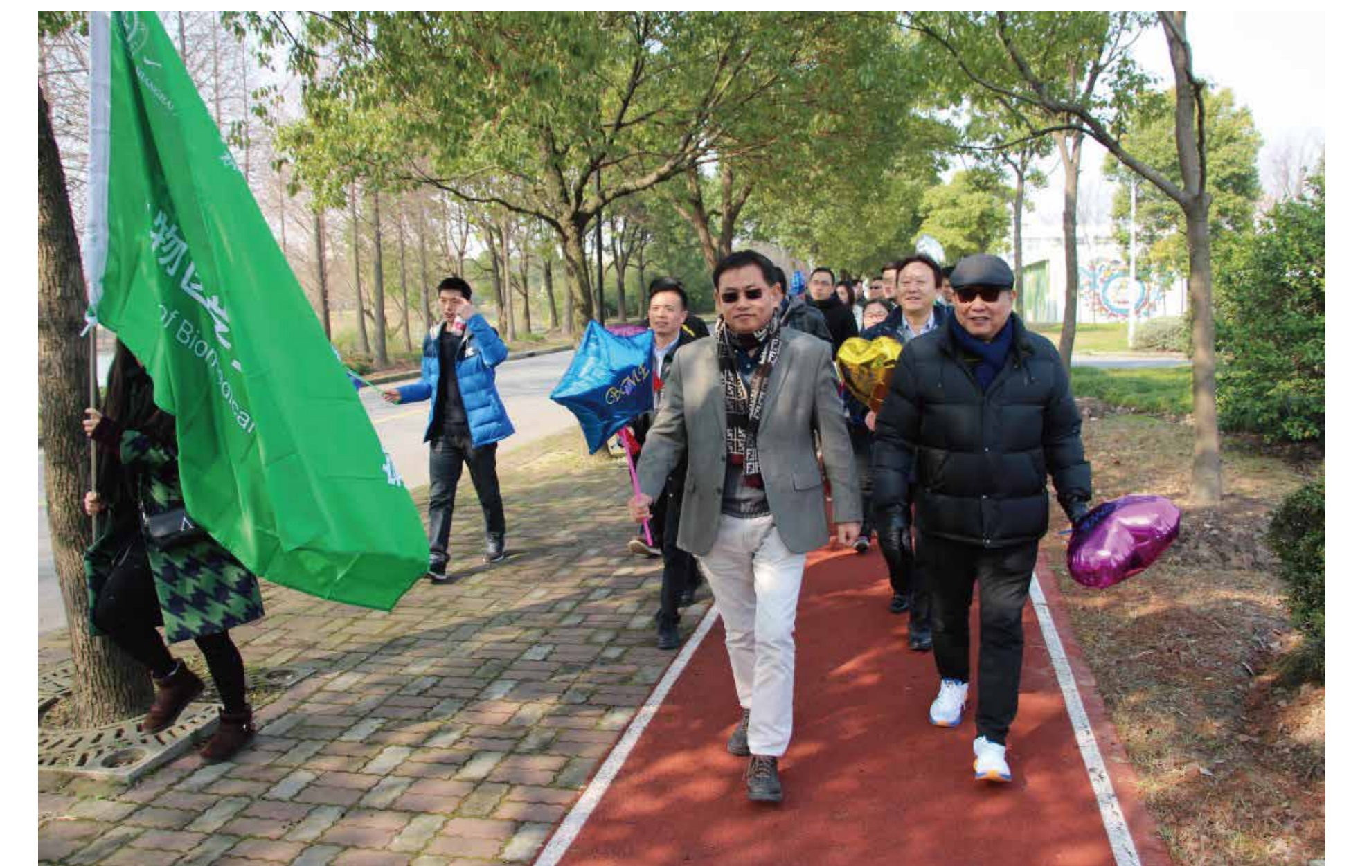
生物医学工程学院工会举行“喜庆党的十九大”和“迎接党的十九大”校园健步走活动